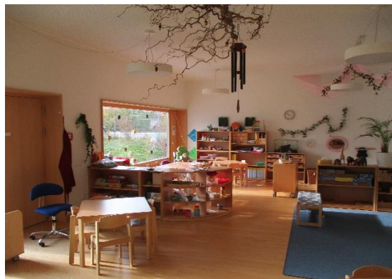
Gruppenräume (Gruppe 1 und 2)