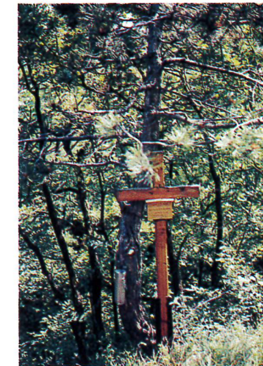
Das „Waldläuferkreuz“ über den Fuchsenhöhlen-Kommunikationspunkt der Wanderer.

Wo stand nun diese Hütte und wie sah sie aus? Es sind die Vereinsprotokolle der Jahrhundertwende, die immer wieder die Begrishhütte erwähnen und damit Antwort auf viele unserer Fragen geben.