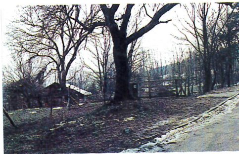
Nahe dem heutigen Schafstall an der Schutzhausstraße stand die Rablhütte. Links zweigte der Zugang in den Gastgarten ab, von dem heute nur noch ein kurzes asphaltiertes Stück erhalten geblieben ist.