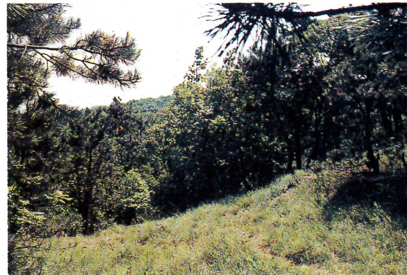
Aller Wahrscheinlichkeit nach stand hier die Begrishhütte, oberhalb der Stelle, an der zu Jahresbeginn 1998 das „Waldläuferkreuz“ errichtet wurde.

Sommerfrische wurde. Es war eine Entwicklung, die beiden Seiten Vorteile brachte: den Perchtoldsdorfern zusätzliche Erwerbsmöglichkeiten, - den Wienern einen wunderschönen und gesunden Sommeraufenthalt in bequemer Nähe der Stadt. Sommergäste stellen aber ihre Ansprüche an das Erscheinungsbild des gewählten Ortes, damals wie heute, und so bildete sich 1868 unter Mathias Begrish ein „Verschönerungs-Comité“. In ständiger Zusammenarbeit mit der Gemeinde hat dieses „Comité“ das Bild unseres Ortes und der Landschaft entscheidend geprägt und tatsächlich verschönert.