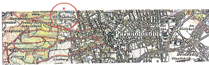
Die Rablhütte auf der Wanderkarte „Baden“ 1 : 25.000 des Bundesamts für Eich- und Vermessungswesen 1989 (Neuaufnahme 1962) - zu einem Zeitpunkt, als sie nicht mehr existierte.