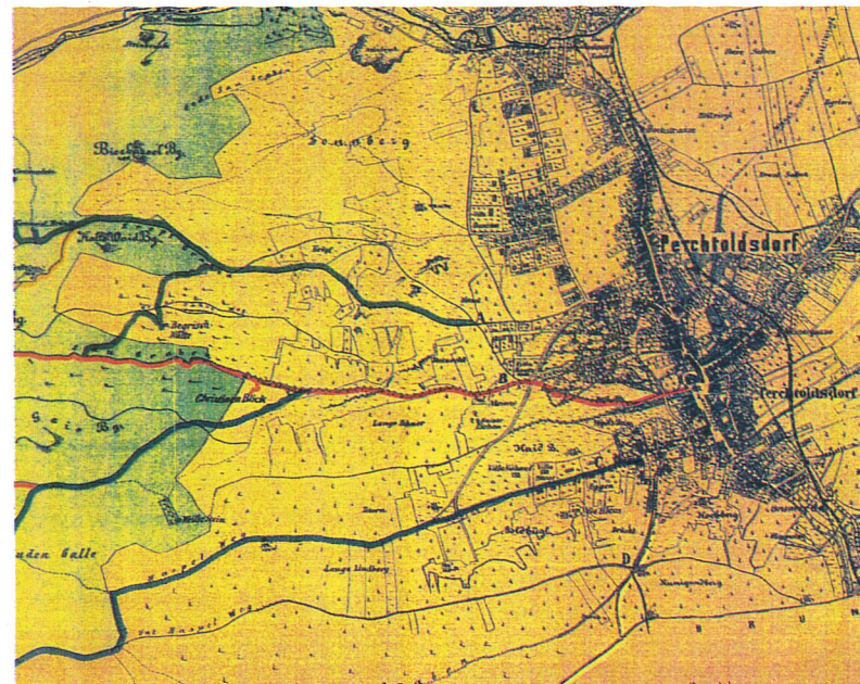
Ausschnitt aus der Orientierungskarte des Verschönerungs Vereins Perchtoldsdorf 1901.

Die Geschichte der Begrishhütte ist eng verbunden mit jener im vorigen Jahrhundert beginnenden Epoche, in der Perchtoldsdorf zur beliebten