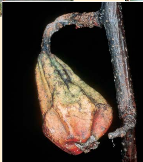
Fruchtmumie einer Birne