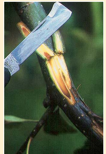
Anschnitt eines infizierten Astes ▶