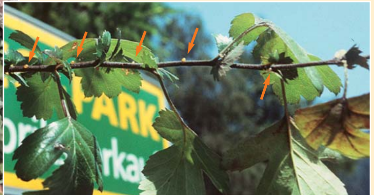
Weißdorn (Crataegus) mit Bakterienschleim