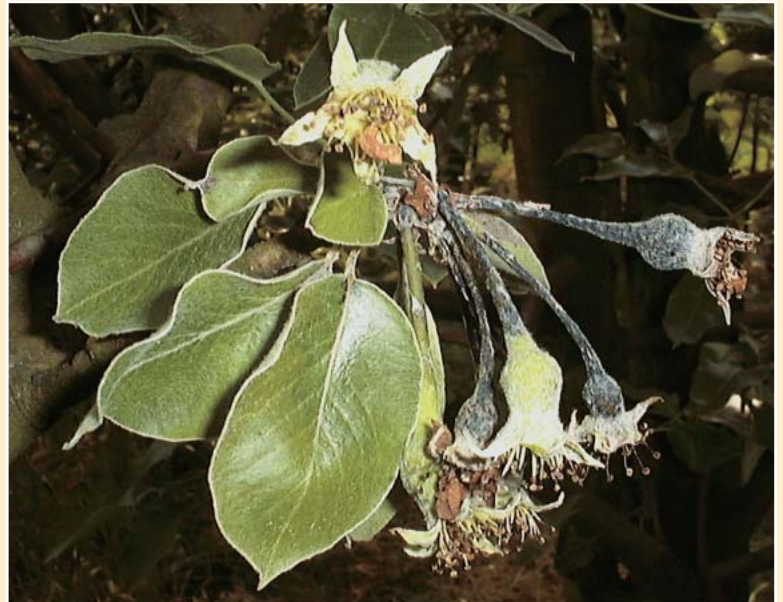
Blüteninfektion an Birne