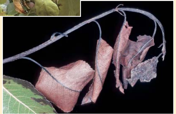
Infizierte Triebe von Apfel und Birne

Sehr unscheinbarer Bakterien- schleim an jungem Apfeltrieb (feuchte klebrige Stelle) ▶