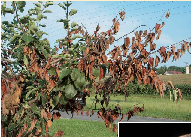
Typische Feuerbrand-symptome an Apfel