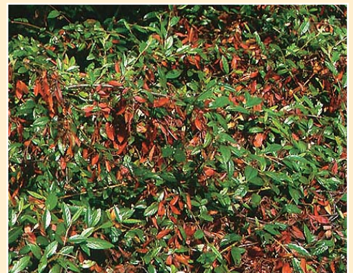
Feuerbrand an Zwergmispel (Cotoneaster)