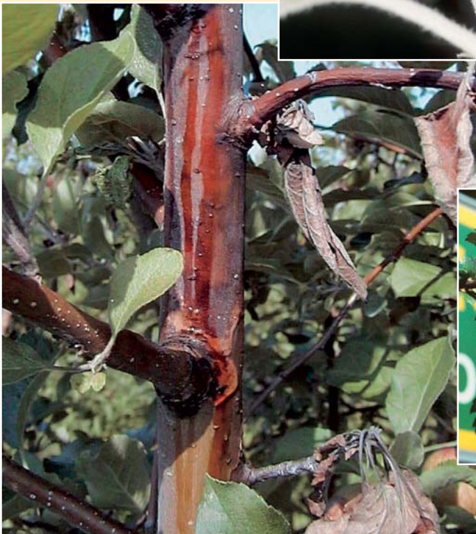
Bakterienschleim entlang des Stammes