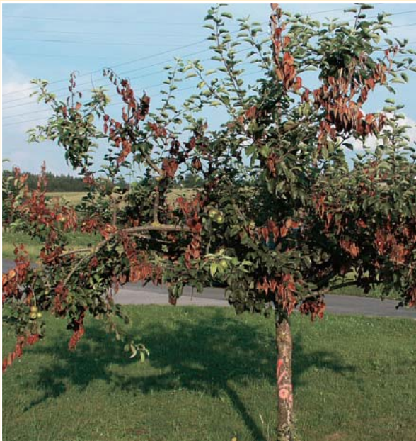
Stark befallener Apfelbaum