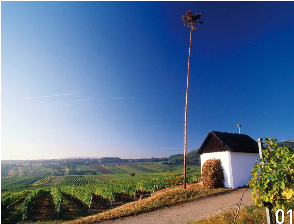
Hiatahütte in der Riede Haschpl.