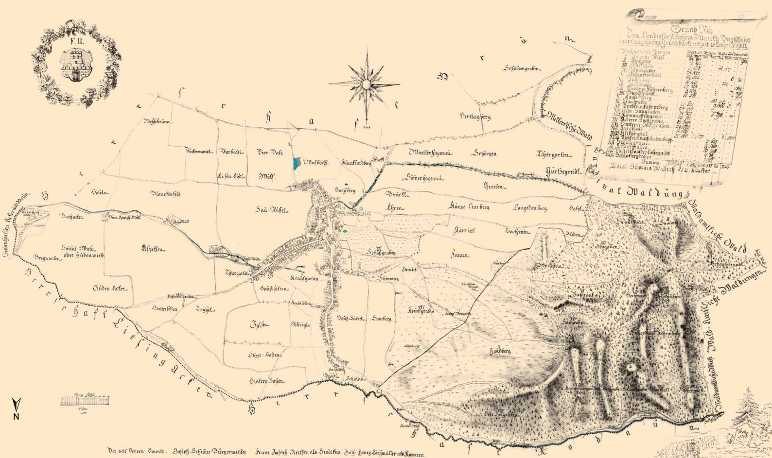
Riedenplan von Franz Prokop [1795]. Kopie von E. Hütter (1883). Niederösterreichische Landesbibliothek – Kartensammlung, Inv.Nr. BV 222.