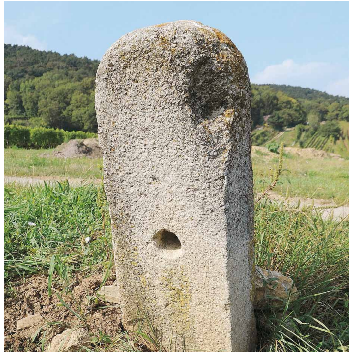
Grenzstein Ende 16. Jhd. am Haspelweg.

Bis auf den unklaren Flurnamen Haschpl sind all diese Namen einfach zu deuten: Hochrain hat mit der abschüssigen Lage zu tun, Juden erinnert ebenso wie die im Osten des Gemeindegebietes vorkommenden Flurnamen Judenacker und Judenwiese an mittelalterliche jüdische Nutzungsinhaber. Lindberg bezeichnet eine mit Linden bestandene Anhöhe, Goldbiegel („der goldene Hügel“) dürfte auf eine besonders günstige Lage hinweisen. Greiten ist ein typischer Rodungsname (mhd. riute – Rodeland). Hagenau hängt mit mhd. hac zusammen und verweist auf ein Gebüsch oder auf eine Hecke. „Sommer-“ und „Winter“-Hagenau beziehen sich auf die sonnen- bzw. schattseitige Lage.