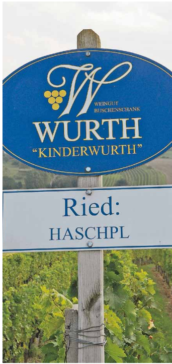
Riedentafel der Familie „Kinderwurth“ in der Riede Haschpl.