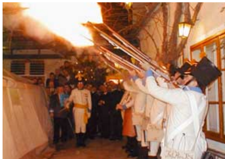
Salut: Die Deutschmeister rückten zur Enthüllung einer Gedenktafel in der Wiener Gasse aus.

Ehrenzeichen und nochmals Salutschüsse gab es zum Abschluss beim Feuerwehrhaus.