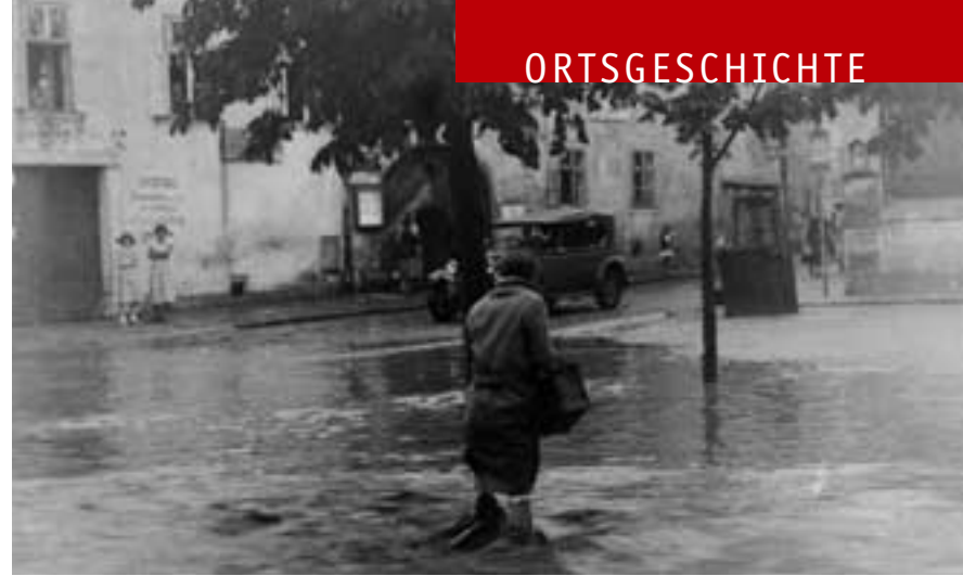
Eine Momentaufnahme Marktplatz/Ecke Elisabethstraße aus dem Jahr 1948: Typhus-Epidemie und der tägliche Hunger wurden durch Hochwasser verschärft.

Perchtoldsdorf quasi im politischen Niemandsland. Angesichts der gewaltigen infrastrukturellen Probleme keine befriedigende Situation, die einem raschen Wiederaufbau Perchtoldsdorfs zuträglich gewesen wäre. Öffentliche Investitionen seitens der Gemeinde Wien beschränkten sich auf ein Mindestmaß, da sich Wien und Niederösterreich auf keine Kostenrückerstattung für getätigte Investitionen einigen konnten. So ging der Wiederaufbau seitens der öffentlichen Hand eher träge vor sich, und die seit 1945 in Perchtoldsdorf tätige