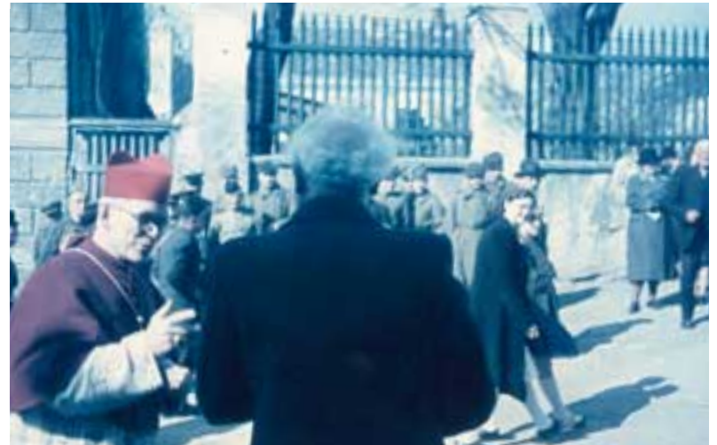
Verbotene Aufnahme in der sowjetischen Besatzungszeit: Geschützt durch den Rücken des Vordermannes drückte der Fotograf am Kirchbergl auf den Auslöser.

Begeisterungstürme rief diese Nachricht in Perchtoldsdorf keine hervor, ganz im Gegenteil. Die wilden Gerüchte machten im Som-