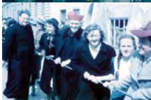
Was die Pummerin für Österreich war die Glockenweihe am 7. April 1946 für Perchtoldsdorf. Bei diesem ersten großen Fest nach Kriegsende war ganz Perchtoldsdorf auf den Beinen.