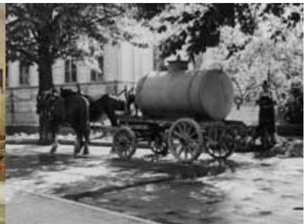
Links: Trotz Besatzung und Nachkriegselend kam 1948 der Weinbau wieder in Schwung: Lesewagen in der Hochstraße. Rechts: Wasserversorgung der höhergelegenen Ortsteile Anfang der 1950er Jahre. In der Sonnbergstraße wird ein Wasserwagen aus einem Hydranten betankt.