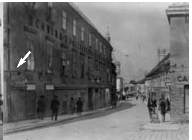
Links: Verlängerung der Linie 28 von Meidling über Atzgersdorf nach Perchtoldsdorf in Beisein des Bezirksvorstehers, Ostern 1953. Rechts: Wiener Gasse/Ecke Franz-Josef-Straße mit Wegweiser am Knappenhof in kyrillischer Schrift „Liesing“ (Pfeil).