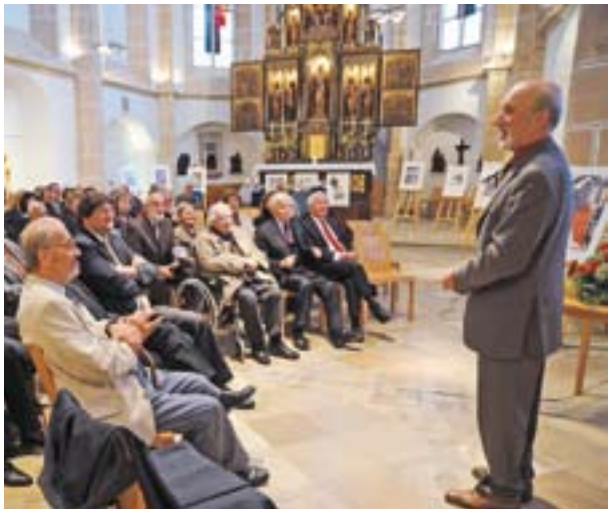
Life & Style fand diesmal zugunsten eines am Angelmann-Syndrom leidenden Kindes statt.