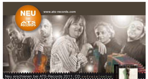
Neu erschienen bei ATS-Records 2011: CD „refrain | color“

Workshops: Kunst // Kreativität // Sport // Musik // Tanz // Literatur // Vorträge // Kinderworkshops. K.U.K.U.K. Kreative Kunst und Kultur O.-Elsner Gasse 6 Perchtoldsdorf T 0664/308 33 42 office@kreative sommerwochen.at http://www.kreative sommerwochen.at