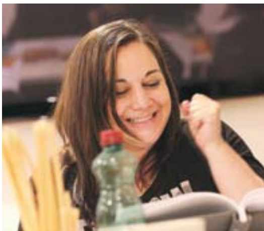
Das Ensemble bei der ersten Leseprobe.