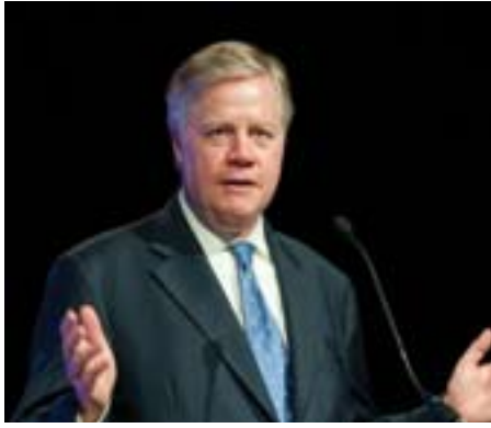
William C. Eacho III, US-Botschafter in Österreich