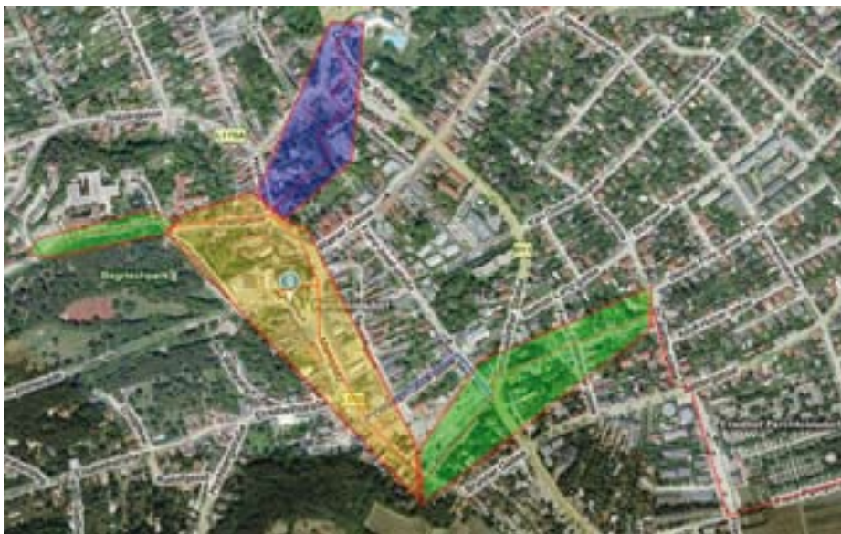
Bauzeitenplan der einzelnen Abschnitte: ■ Grün April/Mai 2011 ■ Ocker Juli und August 2011 ■ Blau September 2011

Die Leitungslegung für das Ortswärmenetz im Ortszentrum – Brunner Gasse, Marktplatz, Hochstraße und Weingasse – erfolgt während der Sommerferien 2011 in zwei Bauphasen mit folgenden geänderten Verkehrsführungen: