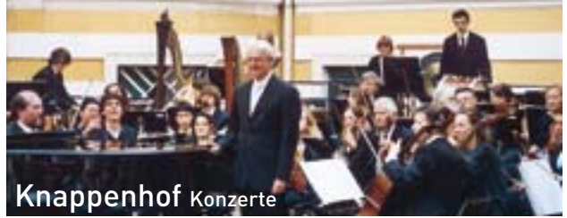
Knappenhof Konzerte sa 18.06 so 19.06

fr 10.06 und sa 11.06 18.00 // Kulturzentrum Beatrixgasse 5a